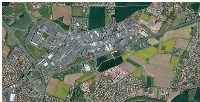
Extrait de la photographie aérienne 2014

L'OCS est une cartographie synthétique dont la méthode de productions s'appuie sur la photo-interprétation (image aérienne ou satellites). Cette cartographie permet à une date donnée, celle de la photographie de référence, d'établir la couverture physique des sols (par exemple, zones artificialisées, zones agricoles, forêts, zones humides,...).