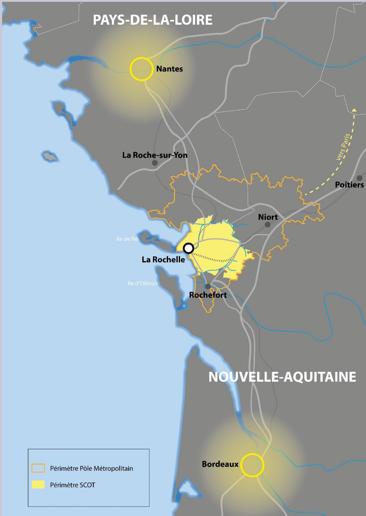
La place de la ville-territoire La Rochelle Aunis entre Bordeaux et Nantes