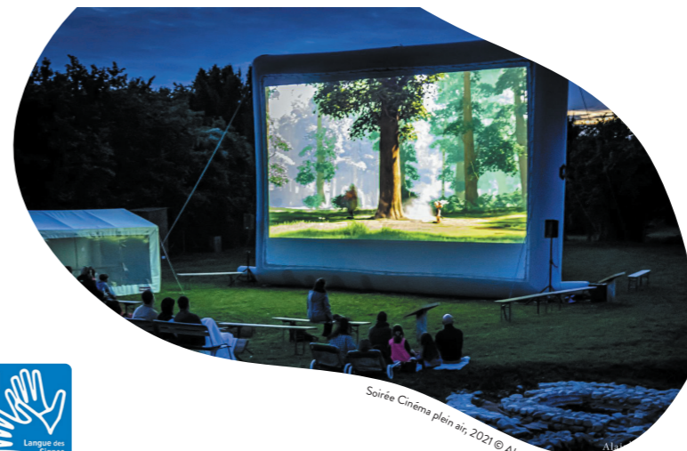
Soirée Cinéma plein air, 2021

Gratuit - Réservé aux adultes pour le stage et tout public pour le temps d'échange Sur réservation