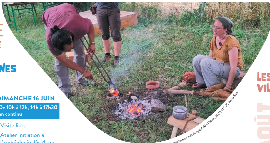
Démonstration métallurgie Arkéo Fabrik, 2023