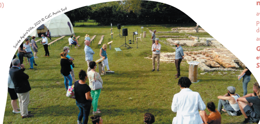
Soirée Apéro Villa, 2021

*Apporter fauteuils pliants, couvertures, lampes torches et friandises