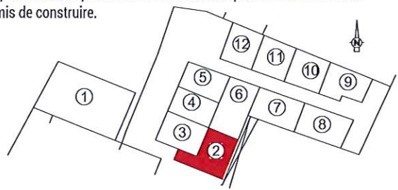
Plan de Situation sans échelle

SYNERGÉO Thierry GILLOOTS - Stéphane MARCHYLLIE - Erick MECHAIN - Géomètres-Experts Sandrine BAULAND - Urbaniste 26 Avenue de la Libération - 17700 SURGERES Tel : 05 46 99 00 36 - Fax : 05 46 99 74 51 email : bet@syner-geo.fr