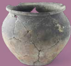
VASE EN CÉRAMIQUE DÉCOUVERT EN 2011

La valorisation du site se poursuit avec le travail de restauration par les compagnons-maçons et le projet de jardin archéologique. Toutes ces démarches faisant vivre le site bénéficient du soutien de nos partenaires institutionnels : la DRAC-État, la Région, le Département et la collaboration entre la Communauté de Communes Aunis Sud et la commune de Saint-Saturnin-du-Bois.