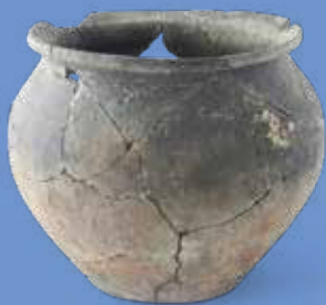
VASE EN CÉRAMIQUE DÉCOUVERT EN 2011

En 2020, la poursuite des fouilles doit permettre de travailler sur la seconde moitié de la cour intérieure (au nord) et de finir l'étude du bâtiment résidentiel (à l'est). Le puits sera aussi étudié avec des méthodes d'investigation particulières.